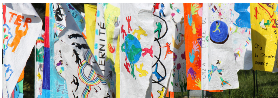
Liberté par les élèves des écoles primaires de Savoie - Plateau des Glières 2016 - photo prise à l'occasion du COMEX.